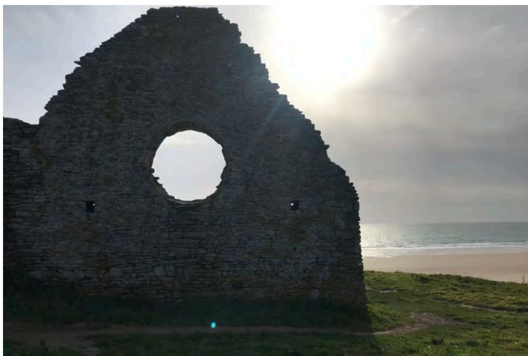
Ruines de Barnevilles