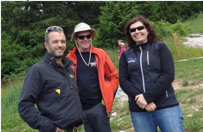
Les « pioupious » à Montmin avant leur premier cross.

P'tit pique-nique et briefing : "petit tour du lac pour se mettre en jambes" déclare le président, et nous voilà sur le majestueux déco de Montmin.